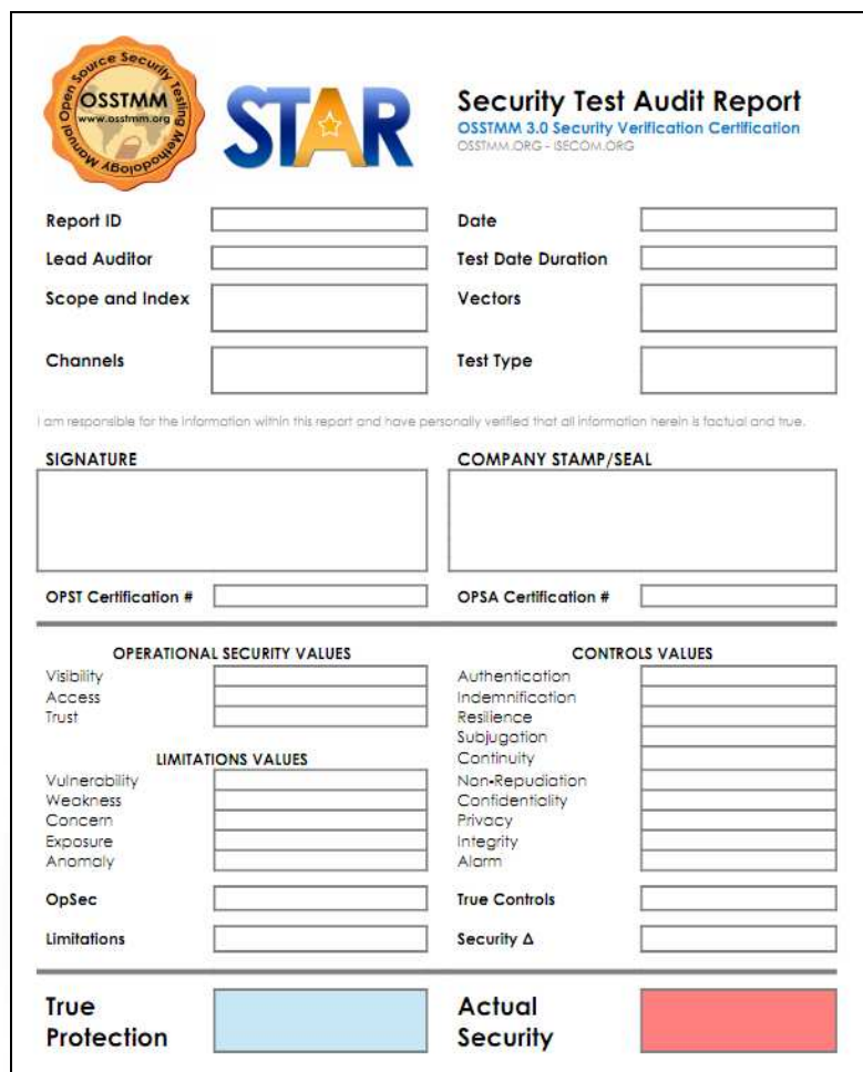
Slika 3. STAR izvještaj o reviziji sigurnosti

izvještajem. Ovjeravanje testova sigurnosti je podložno ISECOM-ovim zahtjevima što osigurava visoku razinu pouzdanosti tvrtke.