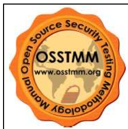
Slika 4. OSSTM pečat odobrenja